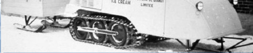
Жозеф – Арман Бомбардье

Он основал компанию Bombardier, известного производителя самолетов, но снегоходы они выпускают до сих пор.